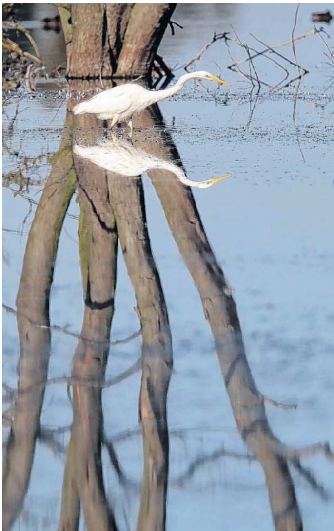
„Spiegeln, Spiegeln“, wer ist der schönste Wasservogel an der Peene?